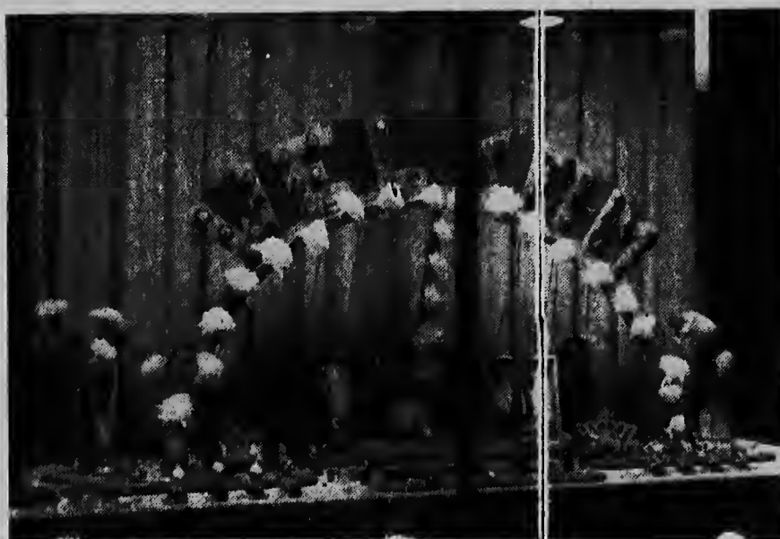
De aantrekkelijke etalage van Spritzer & Fuhrmann (Aruba) N.V. in Oranjestad. Links staat de „Anjer-Beker“, die door de Prins aan de voorzitter van de A.S.U. uitgereikt zal worden en die door deze N.V. geleverd werd.

09.15 u. Aankomst in het Wilhelminapark aan de L. G. Smithboulevard, ter onthulling door H.M. de Koningin van het standbeeld van H. K. H. Prinses Wilhelmina.